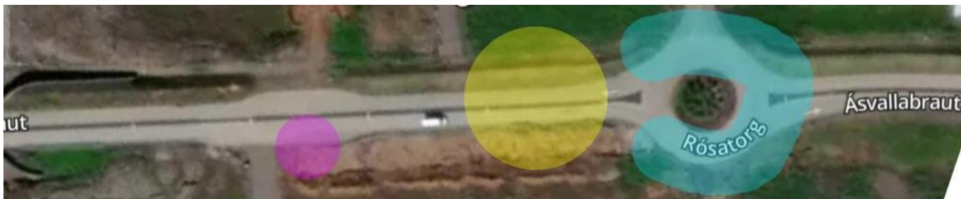
Mynd 2 Rósatorg sunnan við Skarðshlíð við Ásvallabraut. Blár litur merkir mögulegt svæði fyrir stoppistöð við Rósatorg. Gulur hringur sýnir svæði sem stoppistöð gæti verið á ef ekki er mögulegt að koma fyrir stoppistöð við hringtorgið. Fjólublár litur sýnir mögulega stoppistöð þar sem hægt er að hleypa farþegum út.

Einnig væri mögulegt að bæta við stoppistöð þar sem farþegar geta einungis farið úr vagninum við vasa sem er vestan við Rósatorg, sunnan vegar (sjá mynd 1, fjólublár hringur). Ekki er æskilegt að taka inn farþega við þá stöð þar sem farþeginn kæmist aðeins að Rósatorgi. Vagninn þarf að tímajafna við Rósatorg áður en næsta ferð í átt að Firði hefst og vagnstjórinn þarf að geta tekið pásu og farið úr vagninum.